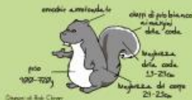
Disegni di Bob Claver

Lo scoiattolo comune è una specie protetta ma in alcune zone sembra in calo anche a causa della competizione con lo scoiattolo grigio, Sciurus carolinensis , originario degli Stati Uniti e introdotto in Italia all'inizio del ventesimo secolo.